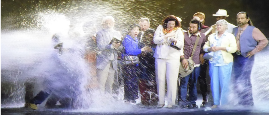
Momentaufnahme aus dem Videokunstwerk „The Raft“ 2004 von Bill Viola